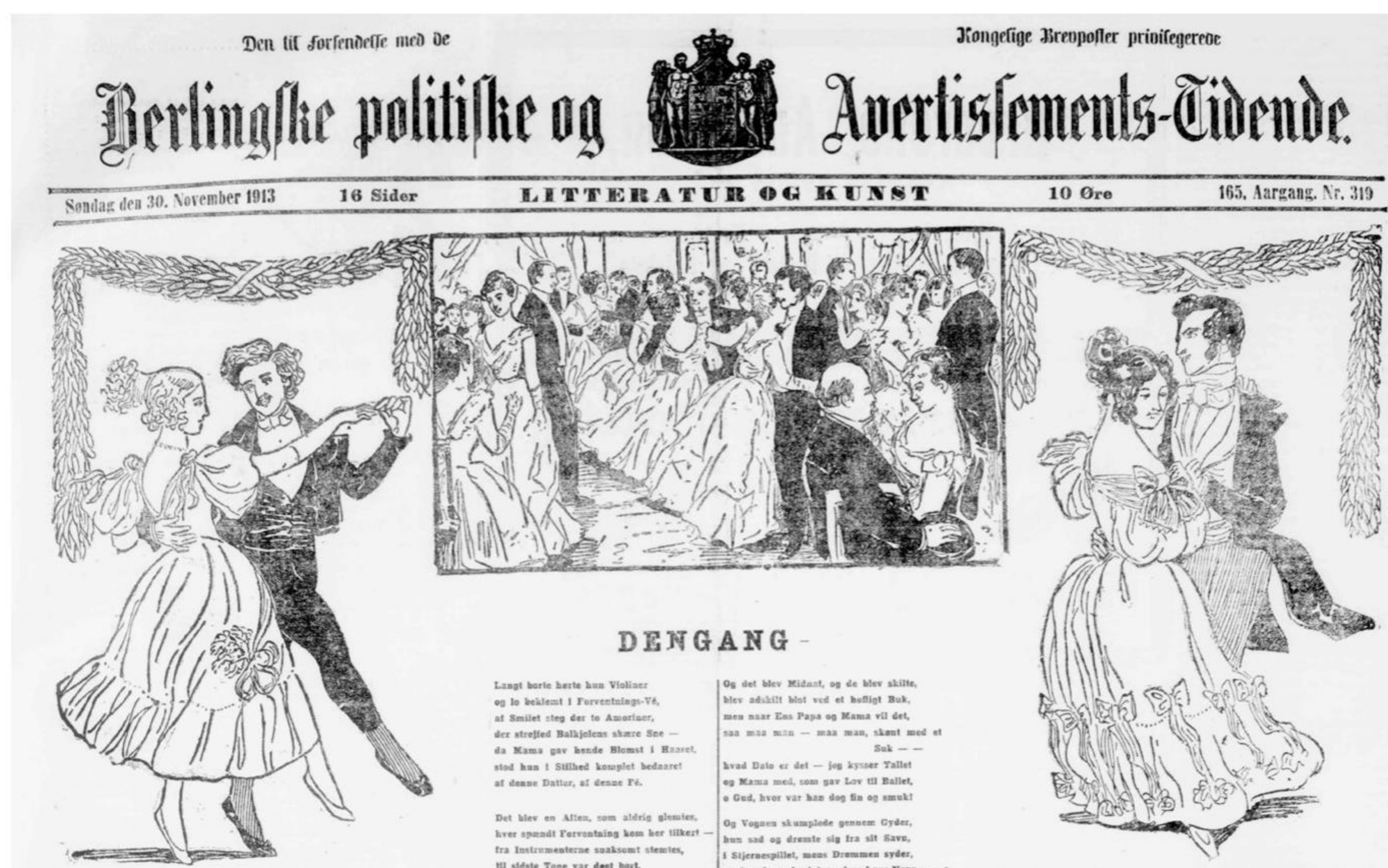
Forsiden til temsiderne om dans.

Søndag d. 30. november 1913 havde Berlingske politiske og Avertissements-Tidende ud over de almindelige nyheder, annoncer og faglige indlæg også et tema om dans på siderne for "Litteratur