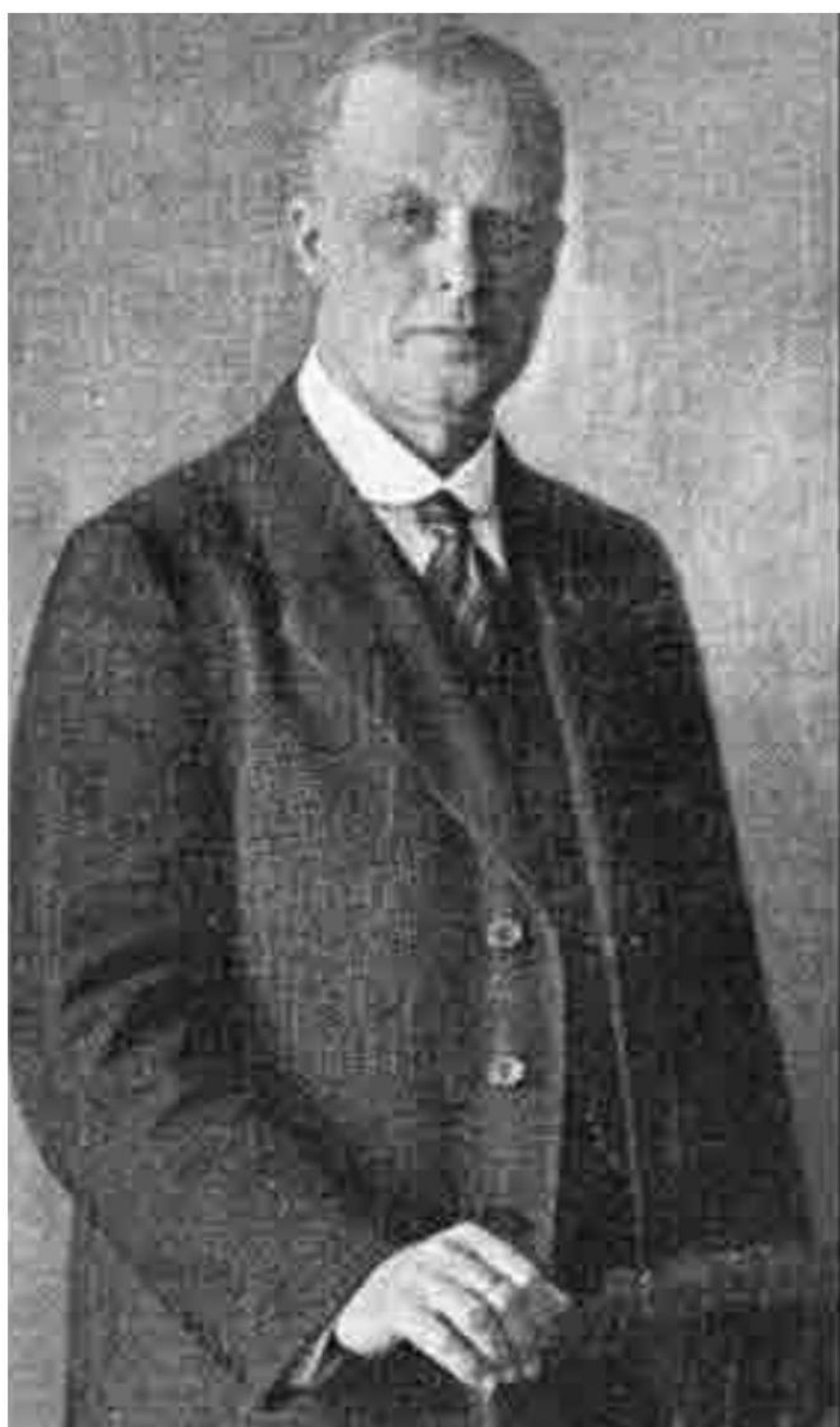
Hans Beck (1861-1952)

Og nu med ét sker så det mærkelige: Ungdommen skyr nu hverken tid eller penge for at lære den meget vanskelige tango, foruden andre dyrelignende gangarter til musikledsagelse, såsom Krebse- og Bjørnedans. Jeg må absolut protestere imod, at benævnelsen "dans" anvendes på denne nye moderne galskab. Rulleskøjterne og Steppemanien fik vi hurtig bugt med, og det er mit sikre håb, at disse nye galskaber også en gang vil forsvinde, lige så hurtigt, som de er komne.